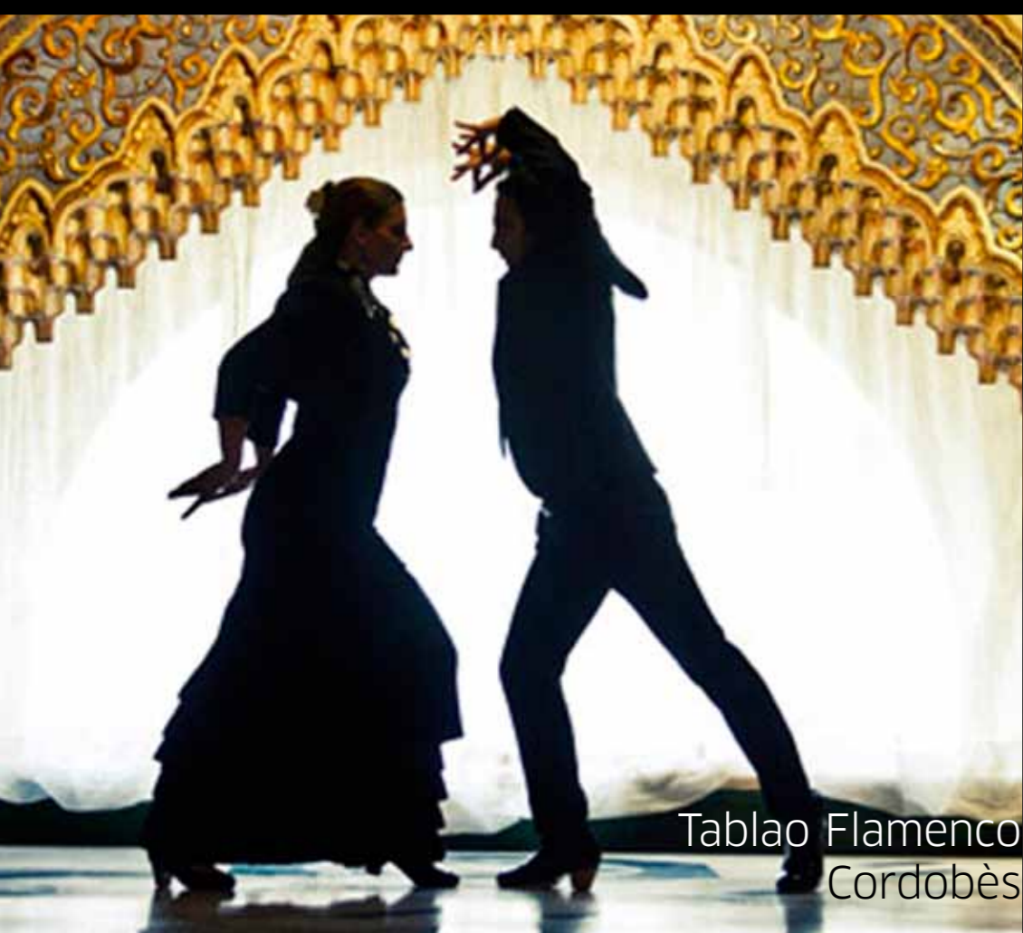
Tablao Flamenco Cordobés