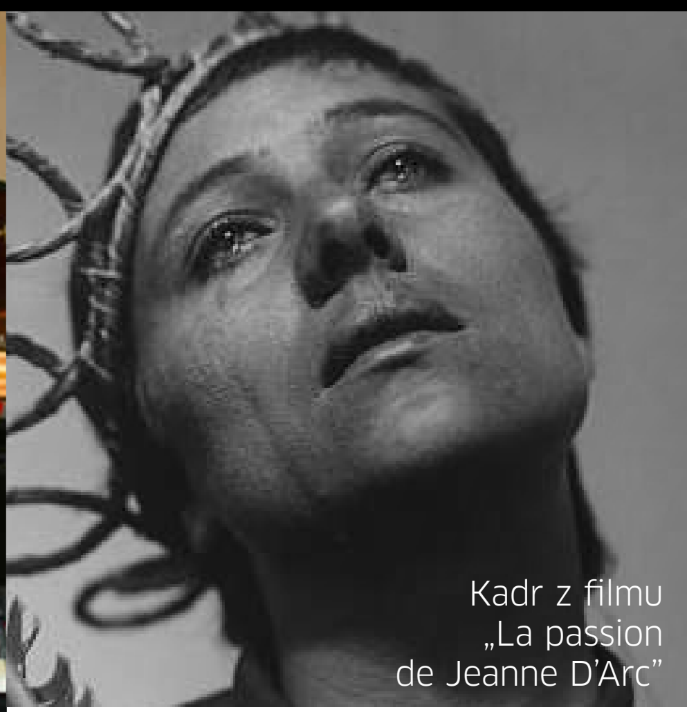
Kadr z filmu „La passion de Jeanne D'Arc”