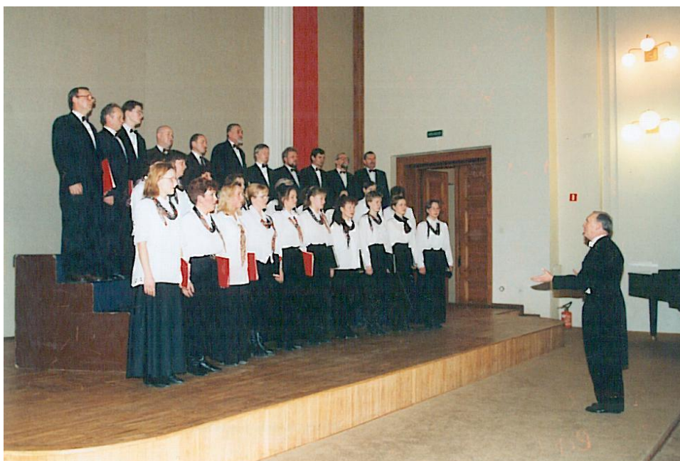
Koncert Kolęd na PG, (2000)